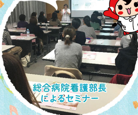
総合病院看護部長 によるセミナー