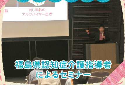
福島県認知症介護指導者 によるセミナー