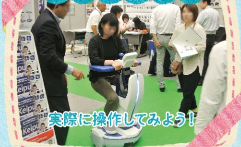
実際に操作してみよう！