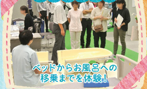
ベッドからお風呂への 移乗までを体験！