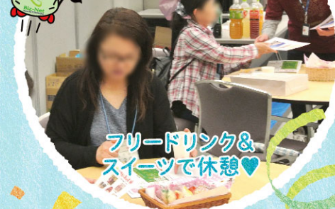
フリードリンク& スイーツで休憩♡